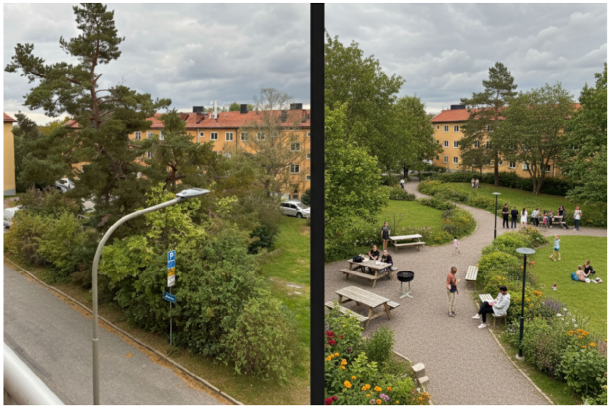
Platsens utformning idag.